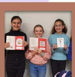
Concours d'écriture des 6ème