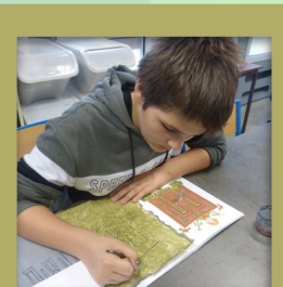
Ateliers "Calligraphie et enluminure"