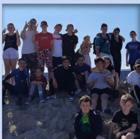
Intégration des élèves d'EGPA