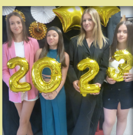
Concours journée de l'élégance