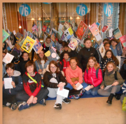
Festival du Livre Jeunesse Rouen