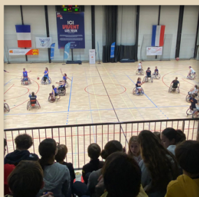
Initiation au basket fauteuil pour les sections sportives