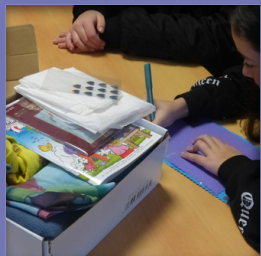
Opération "boîtes de Noël"